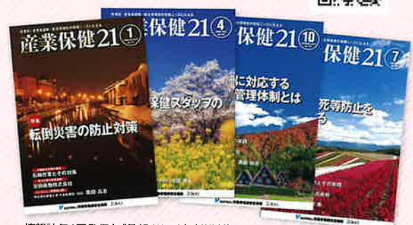
情報誌年4回発行(ご希望者には無料送付)