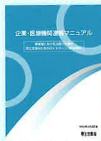
企業・医療機関連携マニュアル

がん、脳・心疾患、糖尿病、肝炎、メンタルなどの病気になった労働者が治療を続けながら安心して働くことができる職場環境づくりをサポートするため、専門スタッフが事業場を訪問し、意識啓発のための研修や制度導入支援、患者(労働者)と医療機関、職場間の個別調整支援などを実施します。