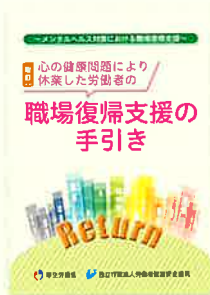
職場復帰支援の手引き