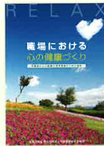
職場における心の健康づくり