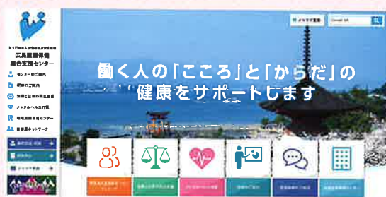
さんぽセンターのホームページ