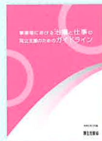
事業場における治療と仕事の両立支援のための指針